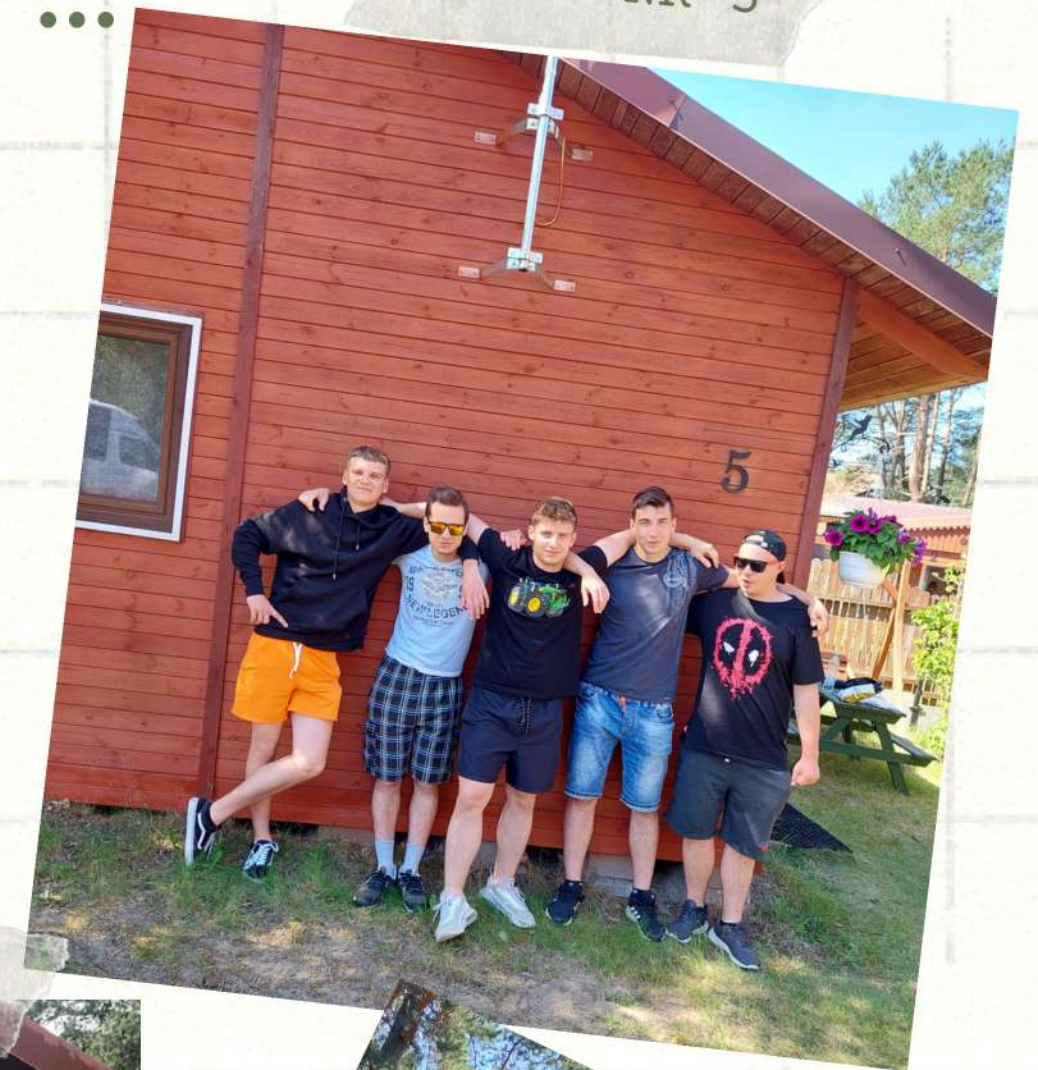
DOMEK NR 5