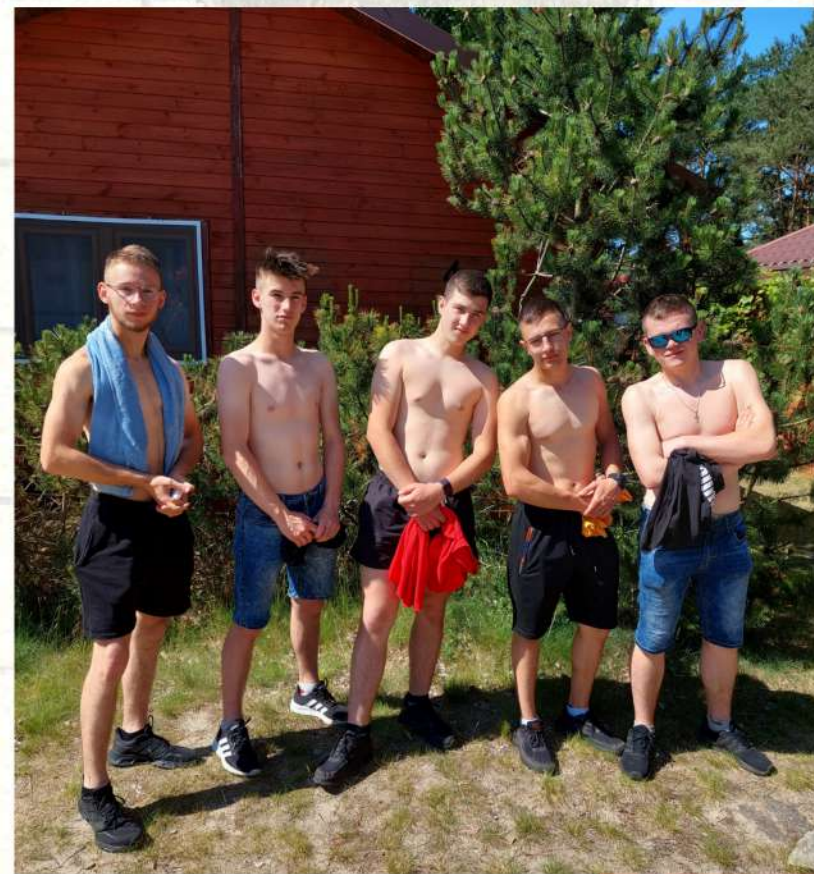
DOMEK NR 4