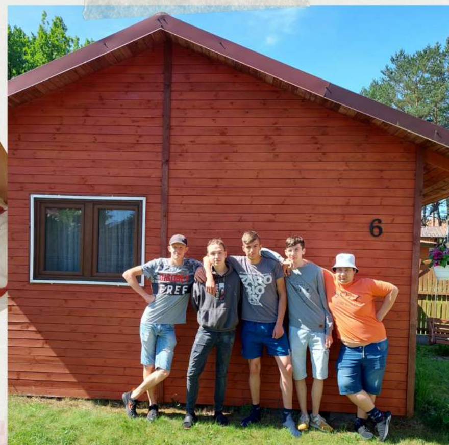
DOMEK NR 6