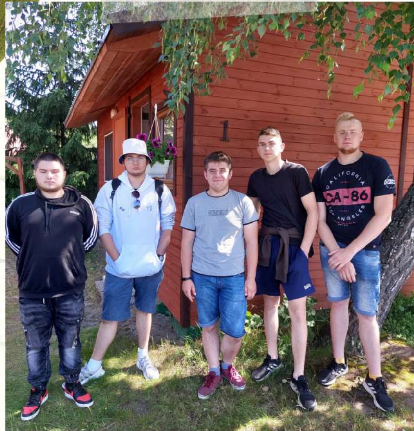
DOMEK NR 1